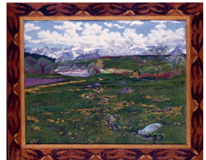
Giovanni Giacometti Primavera